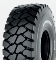
Dynamaxx HAULER GRIP