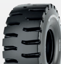
Dynamaxx LUG TRAC