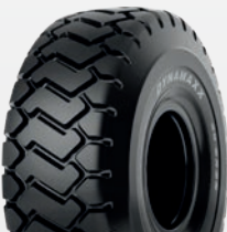
Dynamaxx OMNI GRIP+